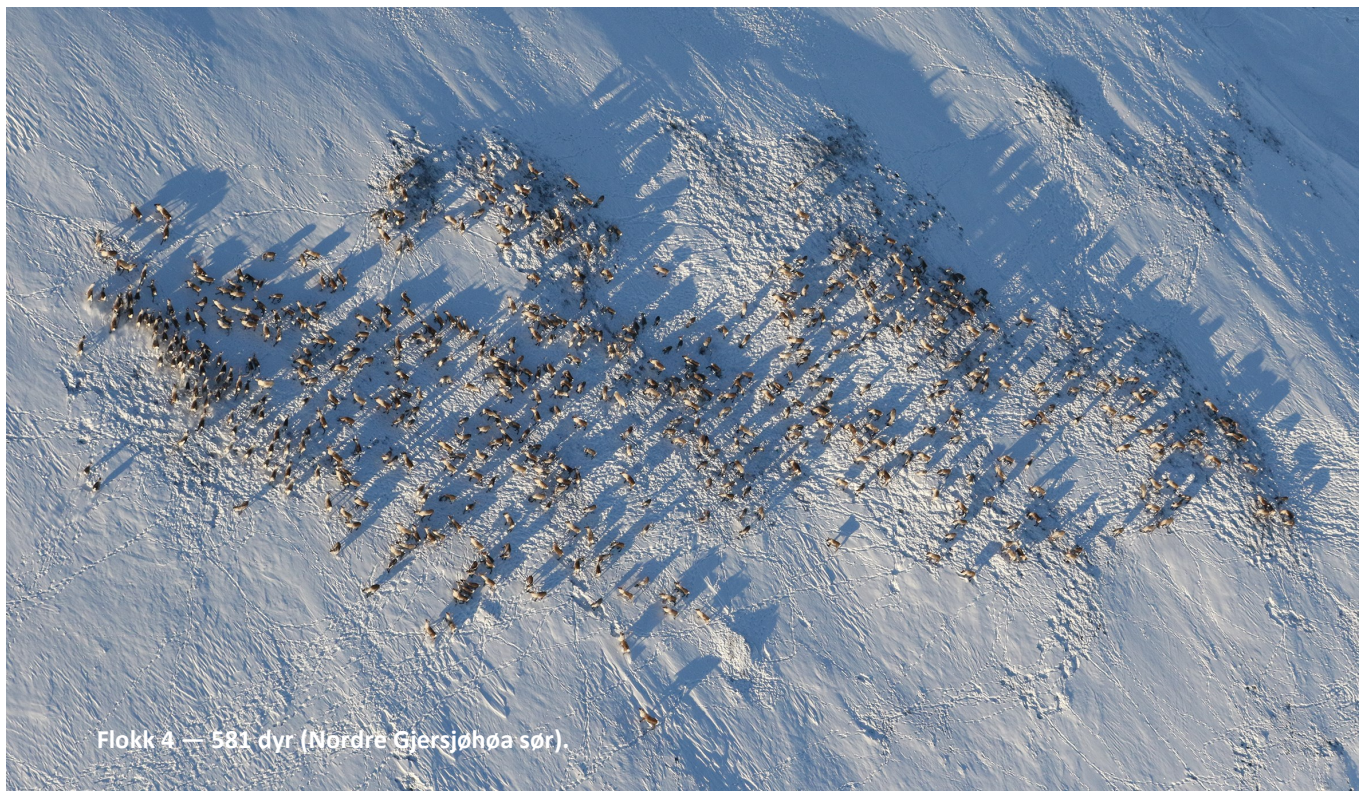
Flokk 4 — 581 dyr (Nordre Gjersjøhøa sør).