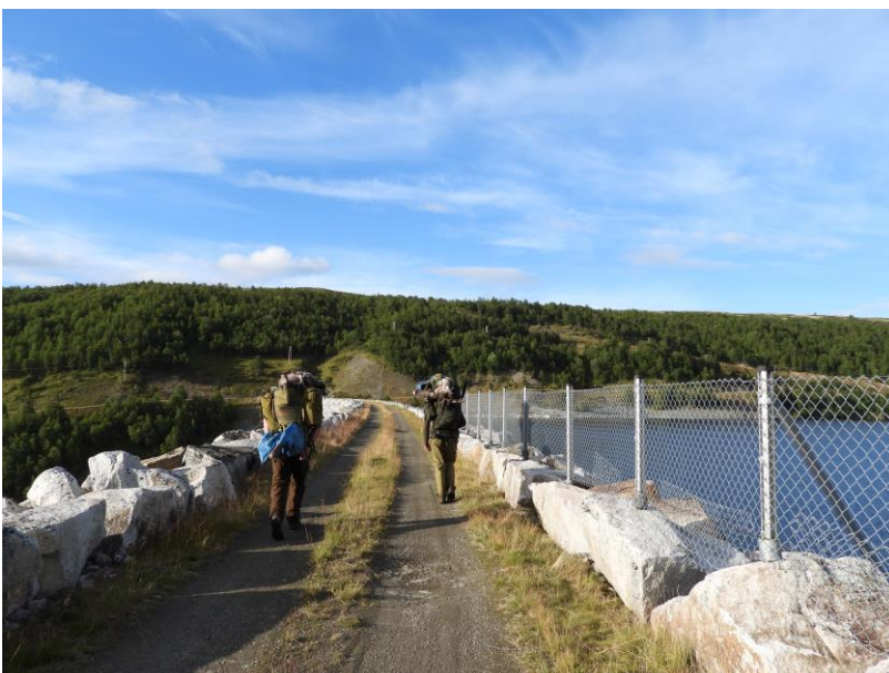
Det ble flere fellinger i området Innerdalen/ Næringdalen i jakta 2020.

Tynset og Rennebu jaktfelt (ToR) var tildelt 140 (114) fellingstillatelser. Ettersom det ikke var noen betaling for overgangsavtalene i 2020 heller fikk TOR beholde alle disse. Av de 140 ble det felt 66 dyr. Det gir en felling på 47 % (31,6 %). I 2020 fikk vi flere perioder med nordavær i løpet av jakta og reinen var da snar og komme seg nordover på Oppdals og TOR- terreng. For TOR sin del var det ekstra moro at en av storflokkene (800-1000 dyr) tok seg turen helt nord til Flomhøgda/Næringdalen. Det ble flere fellinger dagen de oppholdt seg her. Det var også flere mindre flokker i området Flomhøgda, Dølvadfjellet, Gråfloen i et par dager.