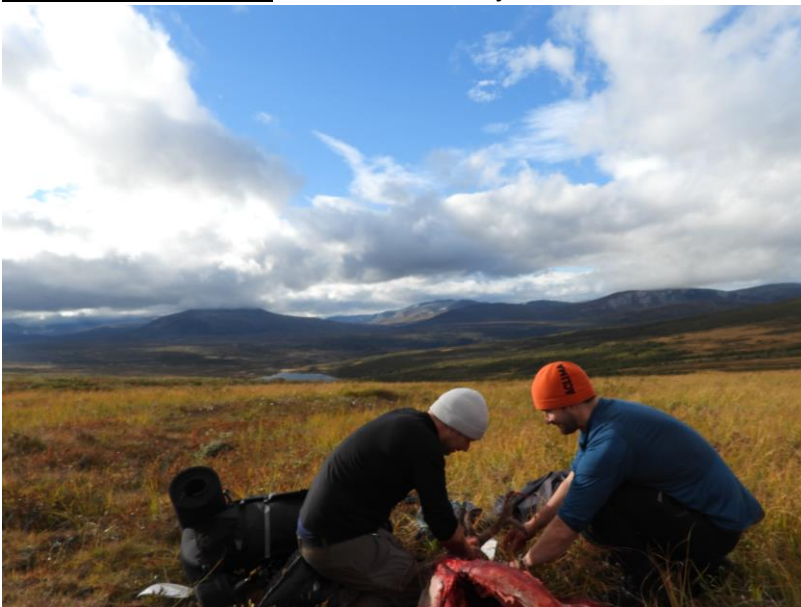
Figur 1 Fra jakta i Knutshø i 2021, ved Armodshøa.

Innleveringsprosenten på kjever og rapportering av nøyaktige slaktevekter har vært varierende i Knutshø. I 2021 leverte 66 % kjeve, noe som er en nedgang fra året før (77 %). Mange innleverte kjever og nøyaktige slaktevekter gir gode data og forutsetninger for å drive ei best mulig forvaltning, men det forutsetter altså at jegere leverer kjever og skriver nøyaktig slaktevekt på kortene. Her har både villreinutvalg, utmarksrådet og rettighetshavere en jobb å gjøre for å få enda flere jegere til å levere kjever og nøyaktig slaktevekt. NINA rapporterer hvert år data og resultater til Hjorteviltregisteret og publiserer jevnlig rapporter med resultater fra overvåkinga av elg, hjort og villrein. Se rapporten «Oppsyn og felling KHØ 2021» som er å finne på villreinutvalgets hjemmeside; www.knutshorein.no for mer informasjon.